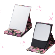
X5 ZOOM-UP PRO MODEL MIRROR