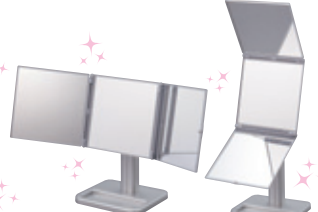
PERFECT STYLE 3WAY MIRROR