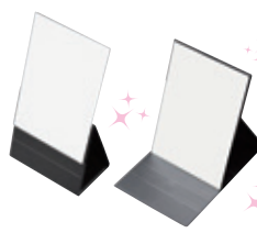
PRO MODEL MIRROR PREMIUM